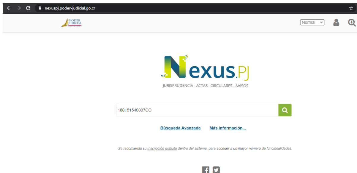
Figura 1. Ejemplo herramienta Nexus