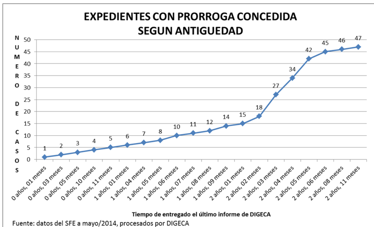
Gráfico 2 Expedientes con prórroga concedida según antigüedad