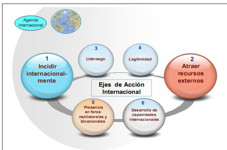
Figura 1: Ejes de acción internacional de la ENCC

Fuente: MINAET. (2009). Estrategia Nacional de Cambio Climático. San José: Editorial Calderón y Alvarado S.A.