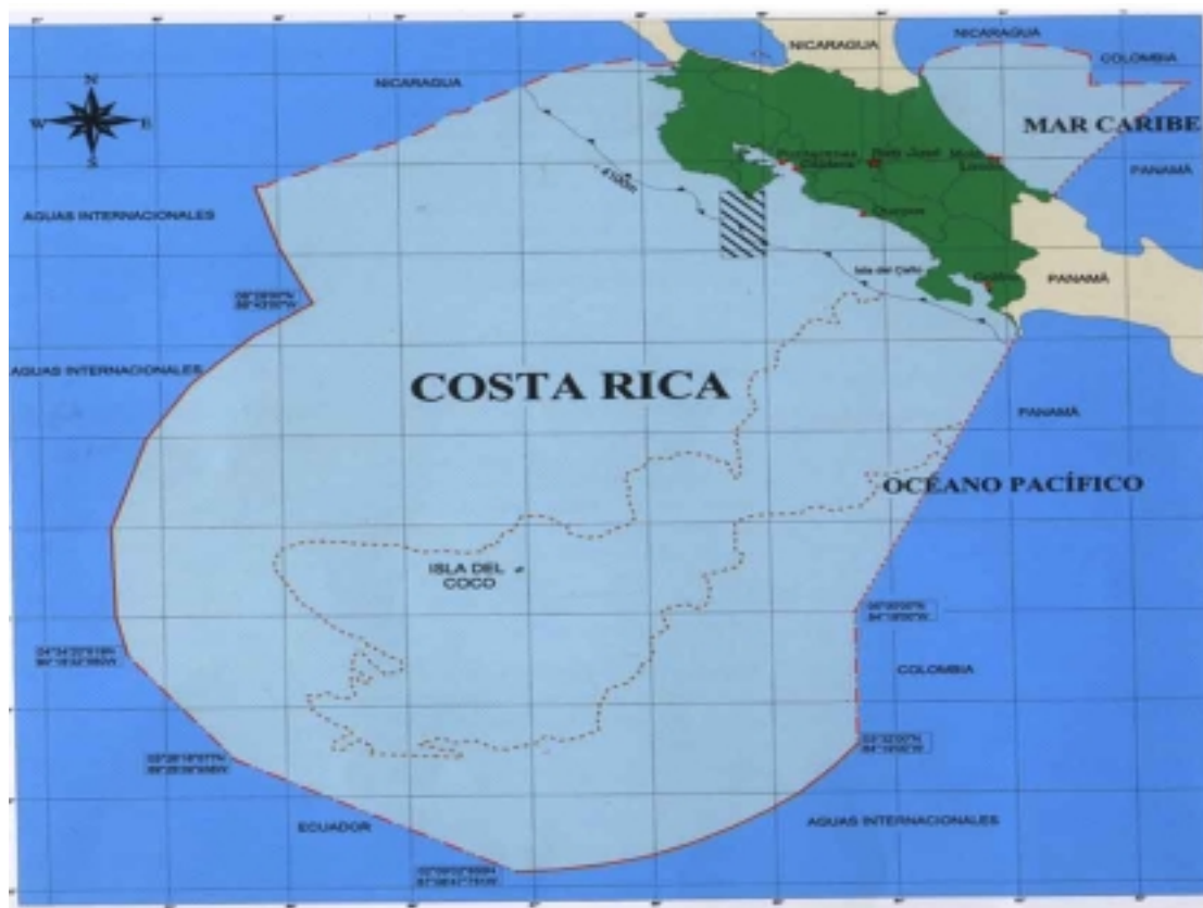
Figura 1. Nuevo mapa oficial de la República de Costa Rica