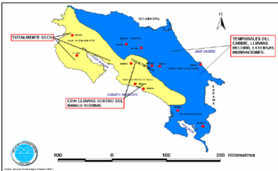
Figura 1. Comportamiento de las lluvias en el mes de enero de 2005 en todo el país

caracterizan la condición de vulnerabilidad y resiliencia de dos de los cantones sobre la que caían cifras récord de precipitación: Talamanca y Sarapiquí. Ambos se encuentran entre los cantones con mayores niveles de hogares pobres (49.7% y 35.1% respectivamente). Talamanca fue el municipio con mayor cantidad de daños en su infraestructura productiva, educativa y sanitaria; Sarapiquí, el cantón con mayor cantidad de personas albergadas (2,186). Los pequeños productores de plátano de Bratsi – distrito de Talamanca con el menor de índice de desarrollo humano a escala cantonal y regional - vieron arrasada su producción por la “llena” (CNE, 2005). Siquirres cuenta con comités y planes comunales de emergencia en cada una de las localidades de alto riesgo; su autonomía de gestión y capacidad de organización frente al evento, le ubicaron entre los cantones con un nivel intermedio de daños.